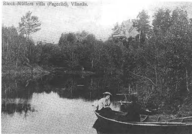
Bild 2. Rieck-Müllers villa Fagerlid i Vännäs.

En insamling av visor från Vännäs har också påbörjats.