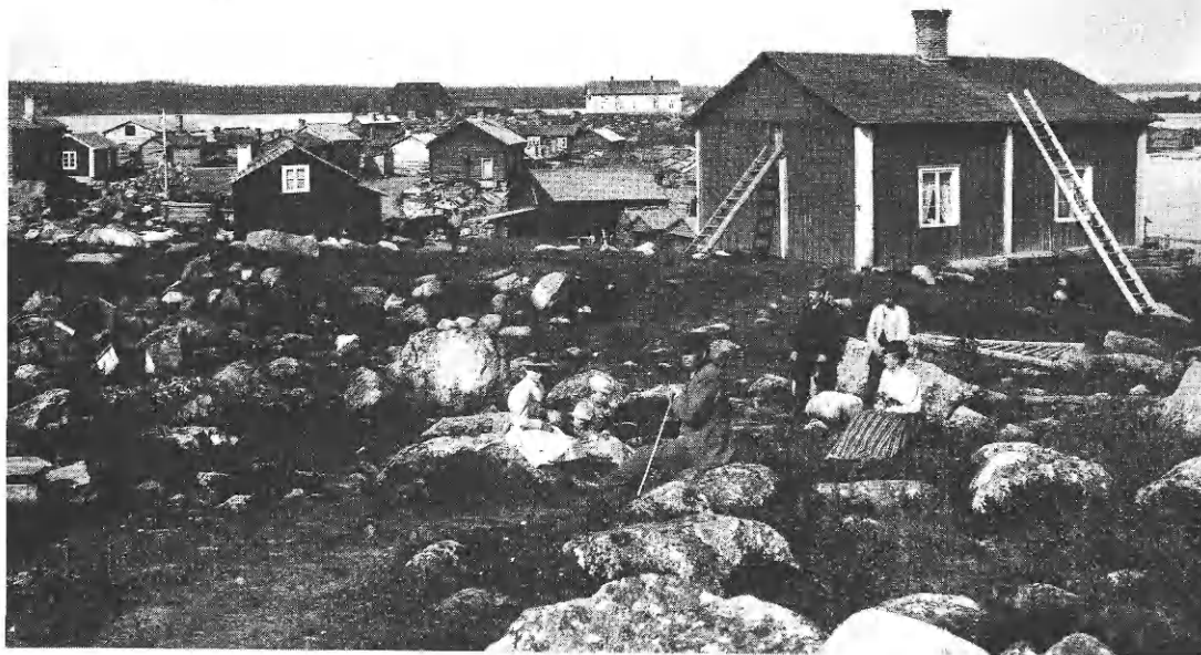
Bild 2. Arjeplog 1893.

marksprästerna om lapsk ortografi. Grammatikprov. Ordlista. (Svenska landsmål och svenskt folkliv 92 [1969]. B. 66. 71 sidor.)