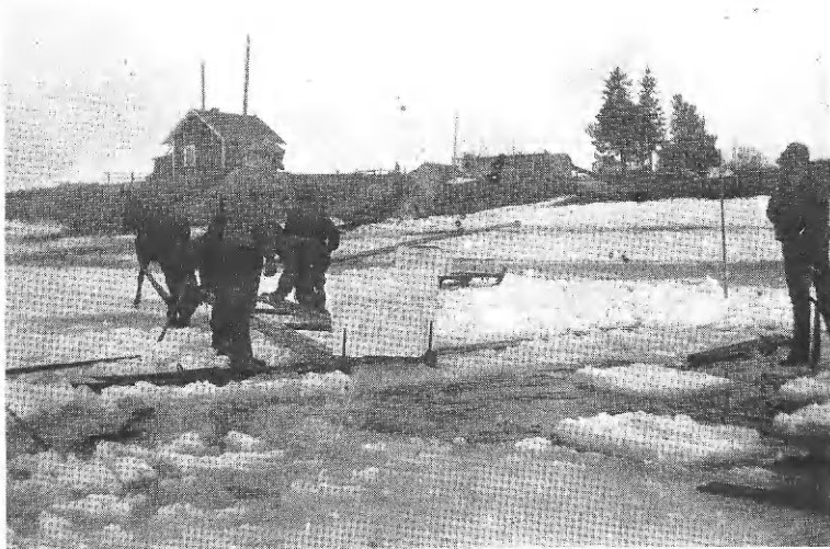
Bild 1. Isupptagning vid Lönnbäcken.

Vännäs kommuns historia , den hembygdsbok som utkom till kommunens 150-årsjubileum 1984, hade knappt tryckts förrän kulturnämnden var igång med nästa projekt — en inventering av äldre bebyggelse i kommunen.