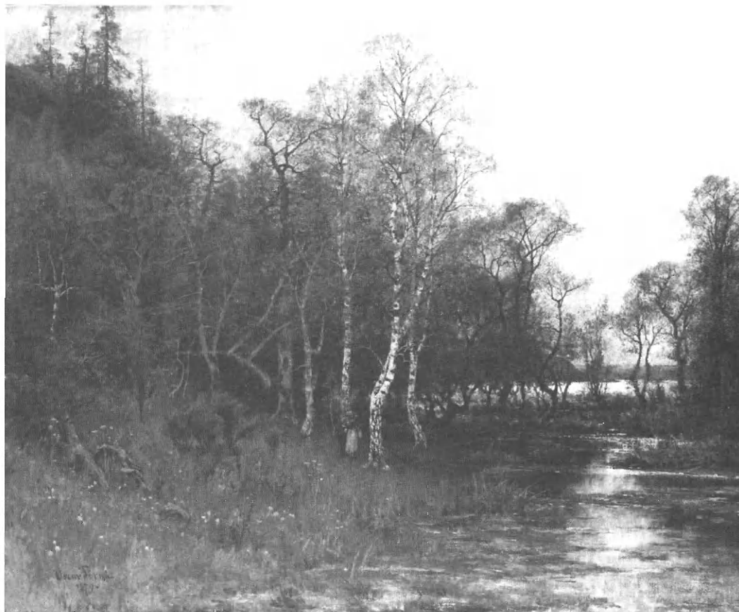
Bild 2. Oscar Törnå, Vårlandskap , 1879. Motiv från Tullinge. Olja på duk 115 x 145 cm, Nationalmuseum Stockholm, NM 1342.

Detta uttalande ger tolkningsmöjligheter. Menade recensenten att den norrländska konstpubliken inte kunde förstå konstnärlig skicklighet eller syftades det på att konst som delade betraktarnas erfarenheter gav en större upplevelse? Jag anser att recensenten gav konstpubliken en viktig del i utställningen och såg den som en pedagogisk gärning, där publiken skapar ny kunskap med de egna erfarenheterna som grund. 67 Inledningen avslutas med att jämföra denna utställning med förra årets och de ska enligt recensenten inte skilja sig nämnvärt kvantitativt. 68 Jämförelsen mellan utställningarna 1884