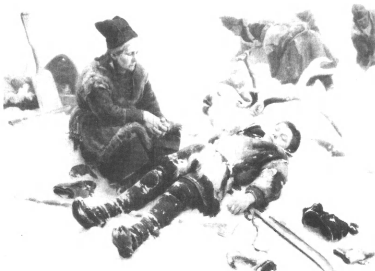
Bild 1. Johan Tirén, Efter snöstormen , 1885. Olja på duk 164 x 215 cm. Nationalmuseum Stockholm NM 1367.