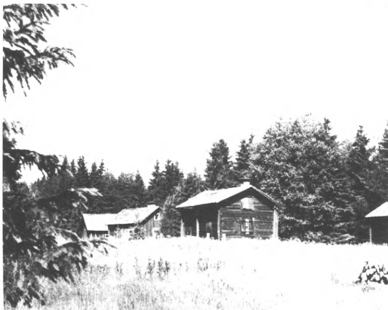
Långmors fäbodnar i Norrala, där salpetersjudning ägde rum bl.a. 1828, 1833 och 1844. Foto: författaren 1960.

sa, Hög, Rogsta, Ilsbo, Bergsjö, Hassela, Bjuråker, Ljusdal och Ytterhogdal. Färila meddelar, att man gjort försök för 20 år sedan men att det ej befunnits lönande. Samma var förhållandet i Delsbo, där man gjort försök i Strandäng.